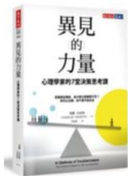
書名 / 異見的力量 作者 / Charlan Nemeth 出版社 / 天下文化 出版日期 / 2019

你可以合群，但千萬不能盲從，為什麼錯誤擺在眼前，大家卻選擇視而不見？在真偽難辨、虛實難分的世界，如果不想被操弄，一定要了解什麼是——異見。