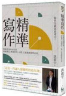
書名 / 精準寫作 作者 / 洪震宇 出版社 / 漫遊者 出版日期 / 2020

主管指派的報告主題，卻不知道該寫什麼內容？洋洋灑灑寫滿的劃案，卻被批評沒有重點？客戶來的 email 不知道如何適切地回覆？知道收集與整理資料，卻不知道如何說服客戶，讓他們受到感動？