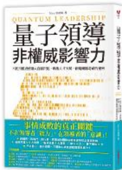
書名 / 量子領導 非權威影響力 作者 / 洪銘賜 出版社 / 采實 出版日期 / 2019

作者洪銘賜，具有豐富的企業轉型、國際化拓展之實戰經驗，他發現，「領導力」就像每個人內建的系統，是人人都可學習的！過去，我們接受的科學教育是壁壘分明、分門別類的「粒子觀」，以為用權威式的語言、指令、行為來管理下屬就有效，但往往成效不彰。而最新的量子力學證明，萬物皆由「意識」決定，即所謂的「量子觀」。