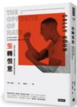
書名 / 逆轉恨意 作者 / Sally Kohn 出版社 / 時報 出版日期 / 2019

愛的相反不是恨，而是冷漠；恨的相反也不是愛，而是連結。你不必為了停止恨人而去愛他們、認可他們，但面對與你意見不同的人，能依舊尊重對方。